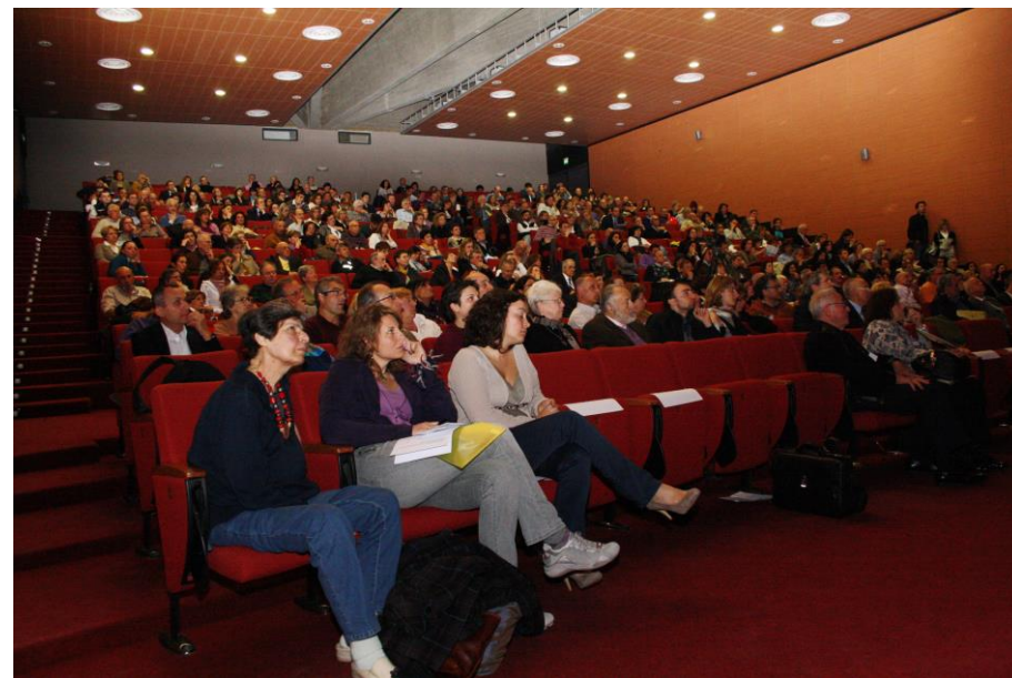
La prima edizione del 2011